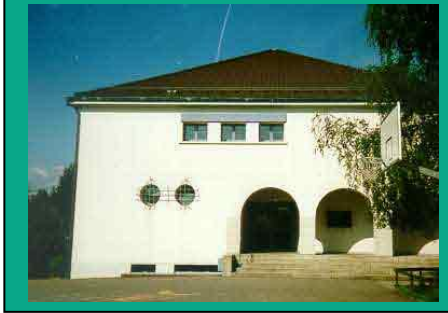
Eingang Turnhalle Fuchsrain