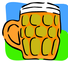
Der Weg ins Training